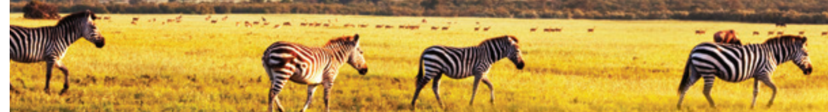
Coucher de soleil sur les zèbres sauvages dans la savane.