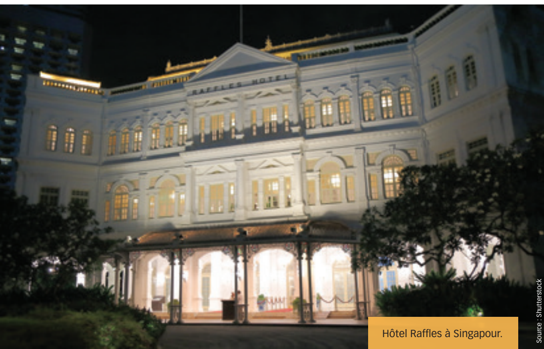
Hôtel Raffles à Singapour.