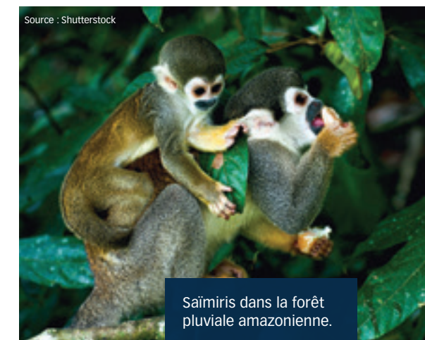
Saïmiris dans la forêt pluviale amazonienne.