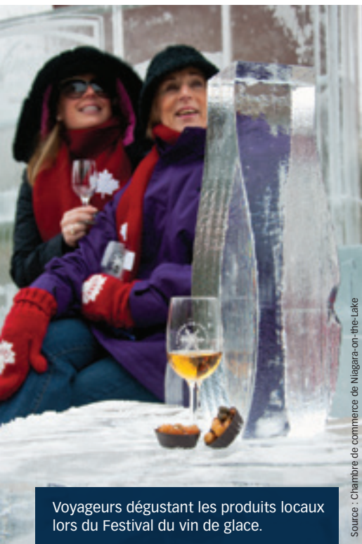
Voyageurs dégustant les produits locaux lors du Festival du vin de glace.