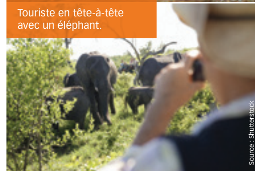
Touriste en tête-à-tête avec un éléphant.

décontracté, dans le décor somptueux du parc. L'expérience est inoubliable.