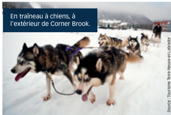
En traîneau à chiens, à l'extérieur de Corner Brook.