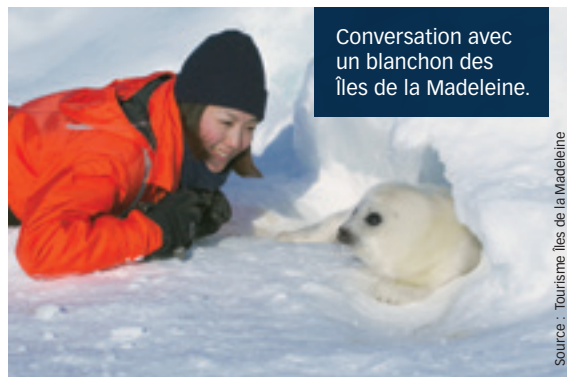
Conversation avec un blanchon des Îles de la Madeleine.