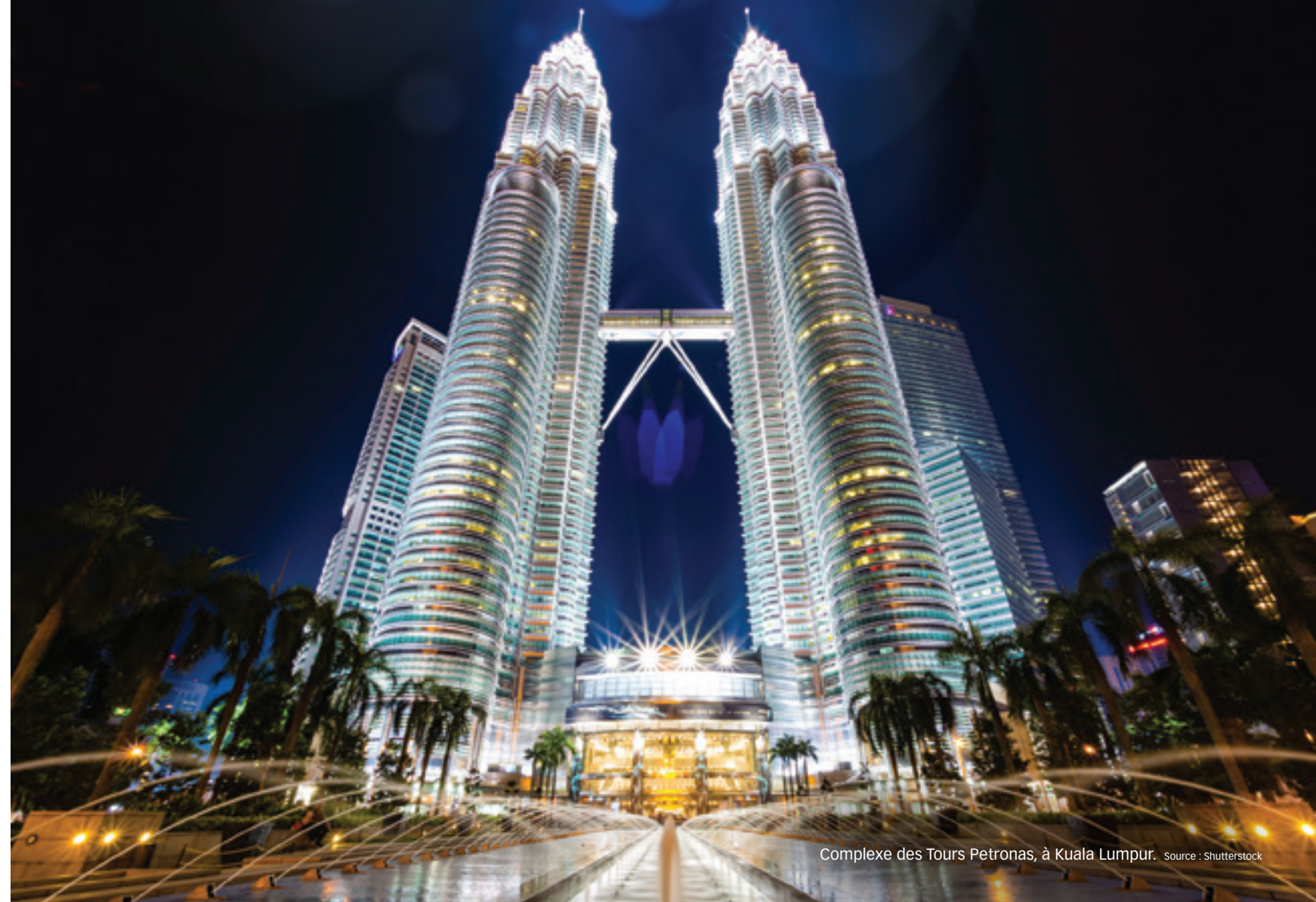
Complexe des Tours Petronas, à Kuala Lumpur. Source : Shutterstock