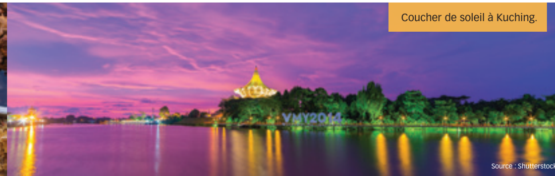
Coucher de soleil à Kuching.

Le dauphin de l'Irrawaddy est une espèce menacée native de l'Asie du Sud-est. De couleur ardoise, ce mammifère de la famille des épaulards est difficile à repérer dans son habitat naturel, à l'embouchure des rivières. Notre capitaine ne pouvait d'ailleurs pas nous promettre que nous en verrions un. Pourtant, après avoir navigué pendant une heure environ, nous en avons repéré quelques-uns semblant faire une parade nuptiale. Même s'ils ne sont pas réputés pour leurs sauts spectaculaires, ces dauphins nous ont néanmoins émerveillés par leur manège, en plongeant et en émergeant de l'eau calme. Regardant ensuite vers le rivage, nous y avons aperçu des singes, des langurs argentés ainsi que plusieurs nasiques – une autre espèce menacée, qui se distingue par son énorme nez recourbé et sa promiscuité