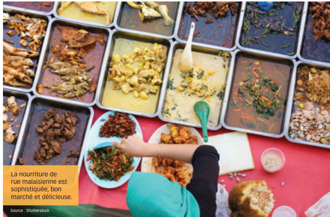
La nourriture de rue malaisienne est sophistiquée, bon marché et délicieuse.

Il avait été facile de nous rendre à Kuching. Ma femme et moi y sommes restés sept jours, effectuant le voyage au départ de Kuala Lumpur. Il nous en a coûté 135 $ pour un vol aller-retour de 90 minutes sur AirAsia. Au cours de notre séjour, nous avons observé des orangs-outangs, des crocodiles, des dauphins et des singes nasiques. Nous avons aussi fait une randonnée dans la jungle et une descente en kayak dans une rivière d'eau limpide, sans jamais manquer de revenir à notre hôtel cinq-étoiles à temps pour une baignade en fin d'après-midi. Nous avons déboursé un peu plus de 600 $ pour six nuitées au luxueux hôtel Pullman, avec chambre meublée d'un