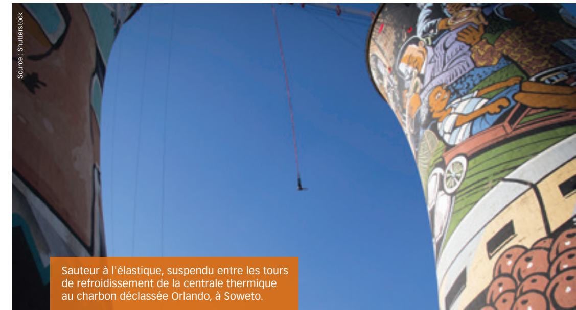
Sauteur à l'élastique, suspendu entre les tours de refroidissement de la centrale thermique au charbon déclassée Orlando, à Soweto.

Cape Town clôture un circuit à merveille. Autrefois station d'approvisionnement pour la Dutch East India Company, la baie de la Table est un quartier métropolitain dynamique, réputée pour son architecture qui conjugue les traditions française, allemande et hollandaise. Contemplez-la à partir d'un téléphérique qui vous fait monter à une altitude de plus de 3 000 pieds et aboutit au sommet du mont Table, qui porte bien son nom. Les paysages de Cape Town, de l'île de Robben et du pic Lion's Head vous couperont le souffle. Vous pouvez même faire un arrêt spécial au phare du faubourg Milnerton.