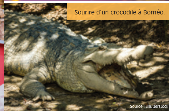
Sourire d'un crocodile à Bornéo.