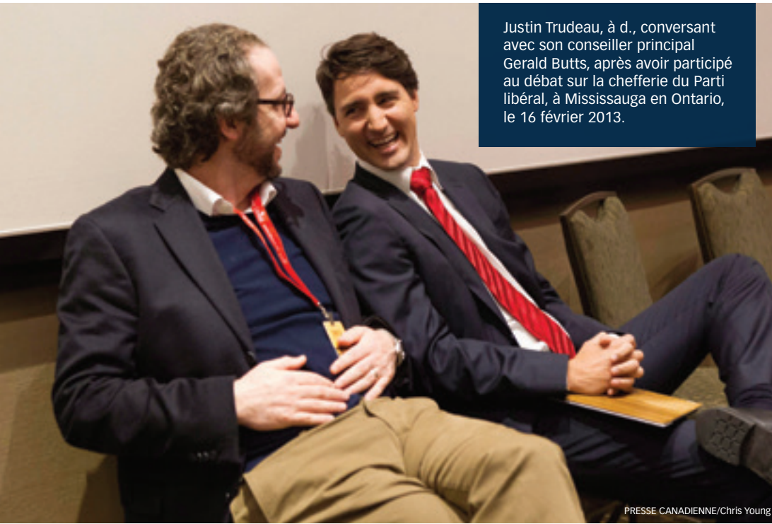
Justin Trudeau, à d., conversant avec son conseiller principal Gerald Butts, après avoir participé au débat sur la chefferie du Parti libéral, à Mississauga en Ontario, le 16 février 2013.