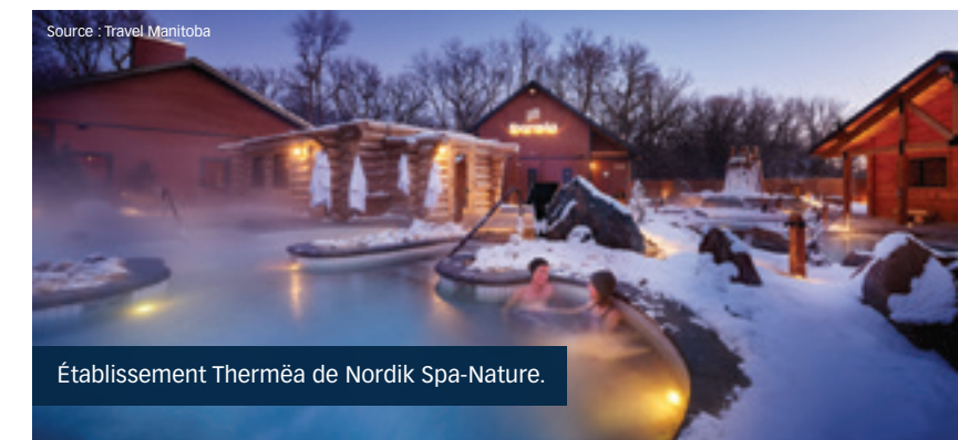
Établissement Thermëa de Nordik Spa-Nature.

Les meilleures vacances d'hiver sont parfois des destinations qui sortent des sentiers battus. La beauté de Terre-Neuve et du Labrador lors de leurs étés tempérés est bien connue. Mais les Terre-Neuviens savent que leur rocher se pare de son plus bel attirail pendant la saison morte. Et le littoral ouest de Terre-Neuve pourrait bien être le secret le mieux gardé pour le ski en Amérique du Nord.