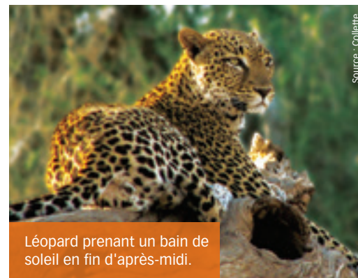
Léopard prenant un bain de soleil en fin d'après-midi.

Explorez ce parc splendide en safari d'une journée à bord d'un véhicule ouvert, le moyen idéal pour repérer les « cinq trophées », surnom donné aux gros mammifères associés à la brousse africaine, qui sont l'éléphant, le buffle, le lion, le léopard et le rhinocéros. Gardez votre appareil-photo en main, car vous verrez également des impalas, des zèbres et des girafes en grand nombre, tout en vous faisant expliquer le mode de vie et le comportement de ces animaux fascinants par un expert local. L'excursion comprend un pique-nique