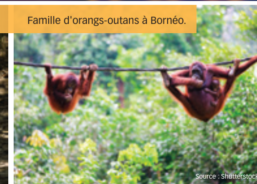
Famille d'orang-outans à Bornéo.