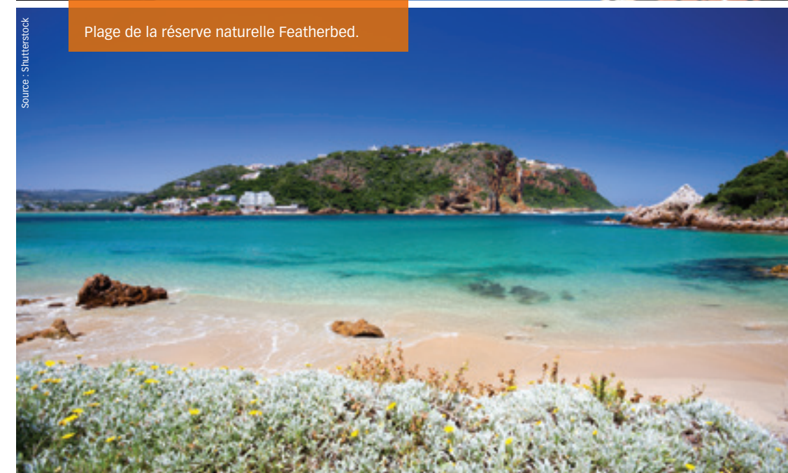
Plage de la réserve naturelle Featherbed.

À partir de Cape Town, partez explorer le magnifique littoral et les charmantes bourgades de la péninsule. Allez voir la pointe du Cap, l'un des endroits les plus septentrionaux du continent africain. Si vous aimez la faune, passez par la plage Boulders pour y voir les manchots.