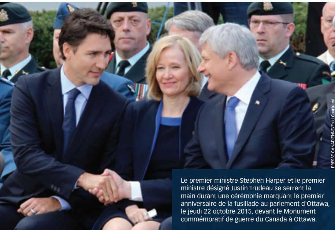
Le premier ministre Stephen Harper et le premier ministre désigné Justin Trudeau se serrent la main durant une cérémonie marquant le premier anniversaire de la fusillade au parlement d'Ottawa, le jeudi 22 octobre 2015, devant le Monument commémoratif de guerre du Canada à Ottawa.