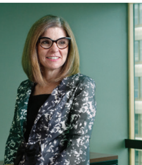
Filomena Tassi est la première ministre responsable des Aînés.

connaissant la plus forte croissance au pays, devraient absolument avoir une voix dévouée pour défendre leurs besoins particuliers au sein du Cabinet, du début du mandat d'un gouvernement jusqu'à la fin.»