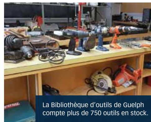
La Bibliothèque d'outils de Guelph compte plus de 750 outils en stock.

Les répercussions sur les personnes qui cherchent à économiser de l'argent, à seulement accéder aux outils dont elles n'ont besoin qu'une fois et à en apprendre davantage sur les outils qu'elles utilisent sont considérables. Il en va de même pour l'impact sur l'environnement. « Ce que nous parvenons à sauver du dépotoir est inouï », indique M me Vollmerhausen. La Bibliothèque d'outils d'Ottawa accepte les vieux