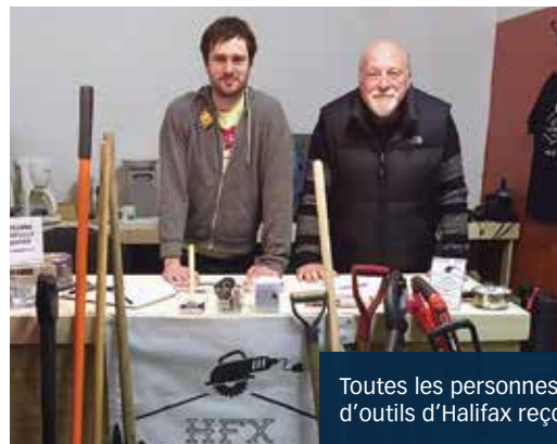
Toutes les personnes qui se présentent à la Bibliothèque d'outils d'Halifax reçoivent des instructions individuelles.