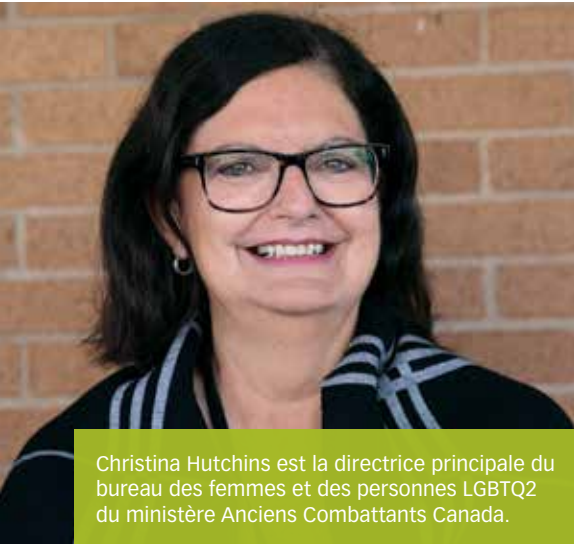
Christina Hutchins est la directrice principale du bureau des femmes et des personnes LGBTQ2 du ministère Anciens Combattants Canada.