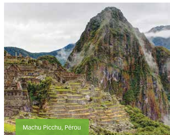
Machu Picchu, Pérou

pas la totalité de la facture du bateau, car lorsque vous réservez avec un voyageur, vous la partagerez avec les quelques autres passagers de votre groupe guidé.