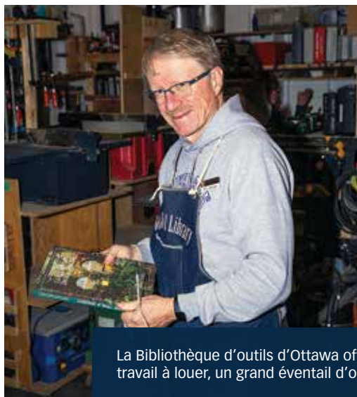
La Bibliothèque d'outils d'Ottawa offre des ateliers, un espace de travail à louer, un grand éventail d'outils et beaucoup de soutien.

Tout comme le partage d'un vélo ou d'une voiture avec d'autres personnes dans le cadre d'un programme de covoiturage, le partage d'outils reflète un désir d'être à la fois pratique et économe. Même si certaines