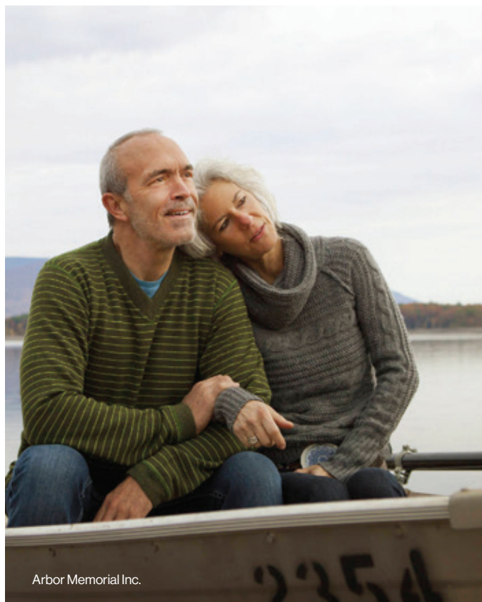
Arbor Memorial Inc.

« Cela me donne le sentiment de vivre », dit-elle. « À ce stade de ma vie, je ne veux pas me rouler en boule dans un coin quelque part pour y mourir. Je veux continuer, aussi longtemps que ma santé me le permettra. » ■