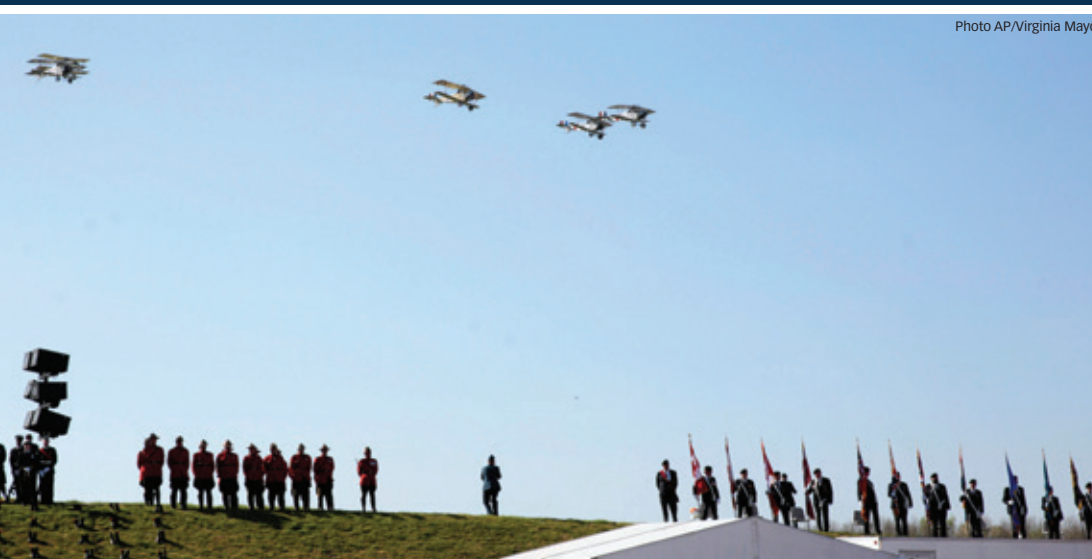
Répliques de biplan survolant une cérémonie marquant le 100 e anniversaire de la bataille de la crête de Vimy durant la Première Guerre mondiale, au Mémorial national du Canada à Vimy, le dimanche 9 avril 2017.