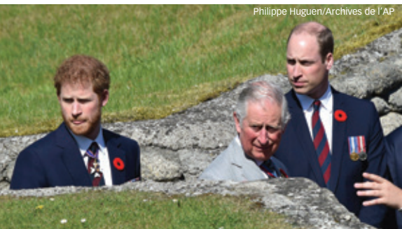
Le prince Charles de Galles de la Grande-Bretagne (au centre), le duc William de Cambridge (à droite) et Harry d’Angleterre, au Mémorial national du Canada à Vimy, le dimanche 9 avril 2017.

« C’est dans ces moments-là qu’on réalise à quel point nous sommes chanceux d’habiter dans (ce) pays. » ■