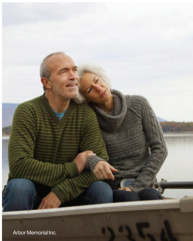
Arbor Memorial Inc.