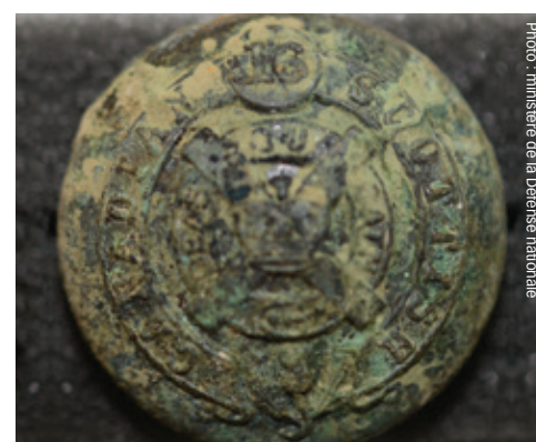
Un bouton en laiton de l'uniforme du soldat Johnston, retrouvé avec ses restes.