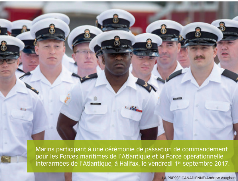
Marins participant à une cérémonie de passation de commandement pour les Forces maritimes de l'Atlantique et la Force opérationnelle interarmées de l'Atlantique, à Halifax, le vendredi 1 er septembre 2017.