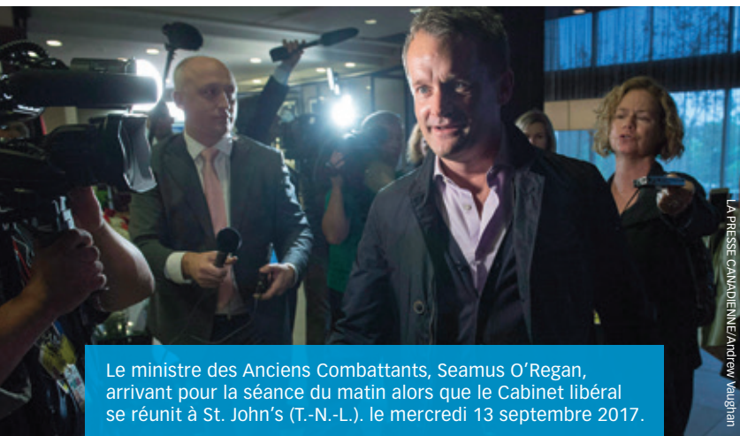
Le ministre des Anciens Combattants, Seamus O'Regan, arrivant pour la séance du matin alors que le Cabinet libéral se réunit à St. John's (T.-N.-L.), le mercredi 13 septembre 2017.

Avant 2006, les anciens combattants invalides pouvaient recevoir une pension mensuelle non imposable pouvant atteindre 2 733 $ pour le reste de leur vie. Le maximum qu'un ancien combattant grièvement blessé pourrait recevoir avec les indemnités pour la douleur et la souffrance selon le nouveau régime serait de 2 650 $ par mois.