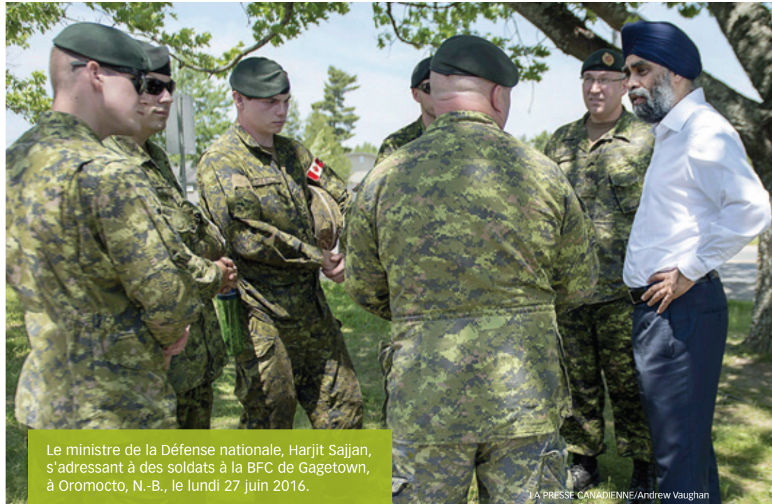
Le ministre de la Défense nationale, Harjit Sajjan, s'adressant à des soldats à la BFC de Gagetown, à Oromocto, N.-B., le lundi 27 juin 2016.

Citant l'Allocation d'études, il souligne que « Si vous avez servi, que vous répondez aux critères sur le nombre d'années de service et que vous fréquentez un établissement d'enseignement reconnu, vous obtenez l'allocation. C'est relativement simple et rationnel ». Les services de transition de carrière seront un guichet unique, poursuit-il,